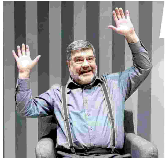
Francesco Pannofino in “Chi è io?”

Ma non finisce qui, perché c'è anche la realtà, quella del mondo dei vivi, dove ognuno ha un ruolo, un legame, un rancore, un desiderio. Tutti abitiamo contemporanea-